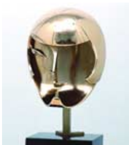
Ayuntamiento de Zaragoza. Museo Pablo Gargallo