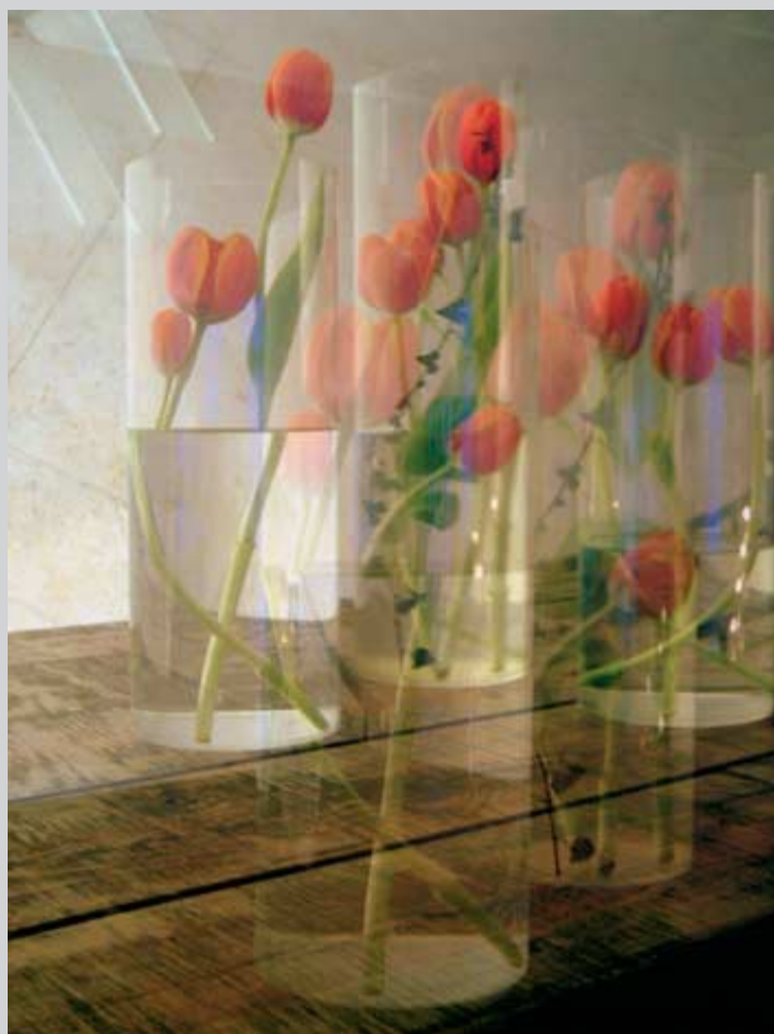
Color hidropónico . Fotografía. 90 x 80 cm

Miembro de VEGAP (1998), CEDRO (1995), SGAE (1997), RSFZ (1987), AAPGA (1987) y Asociación Nacional de Escritores (1994). Presidente de la Asociación de Artistas Plásticos Goya-Aragón (AAPGA) desde marzo de 2006.