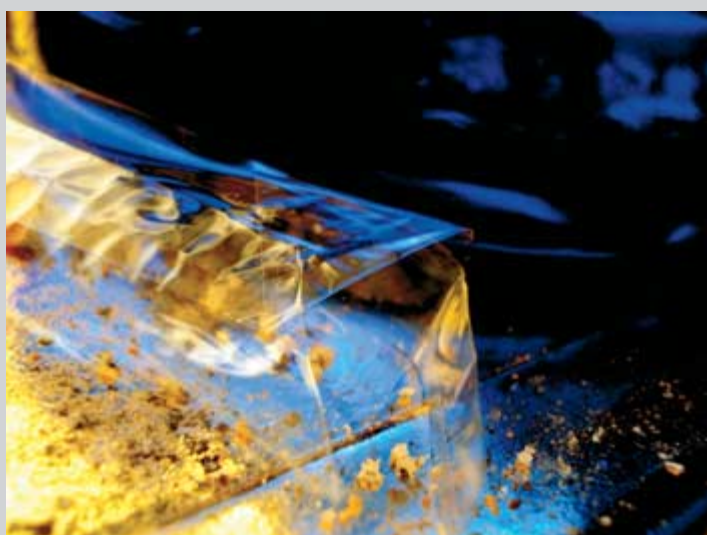
Agua amarga . Fotografía. 70 x 80 cm

Inauguración: Martes, 29 de abril. 19.30 horas