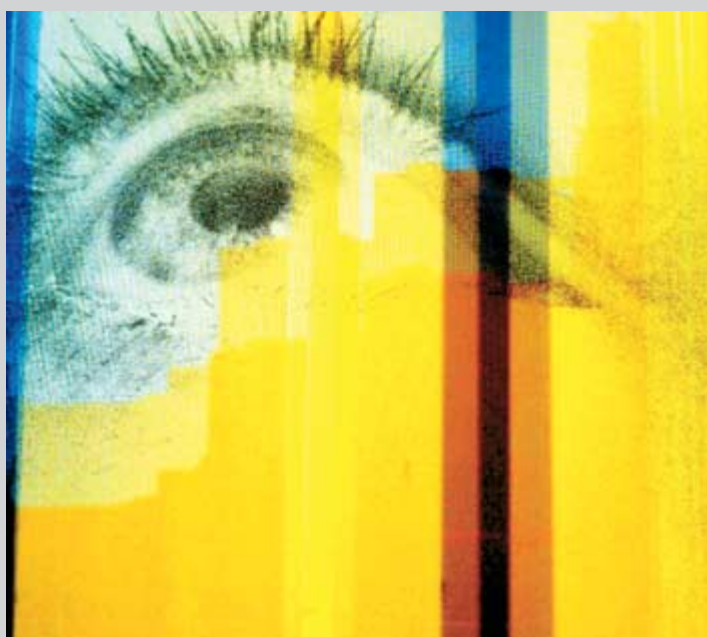
Acuosa mirada urbana . Fotografía. 100 x 100 cm